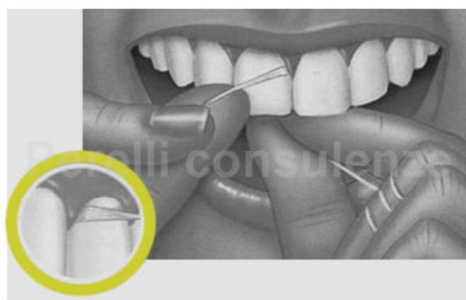
Prevenzione: come usare il filo interdentale

Attenzione a effettuare il movimento delicatamente, facendo attenzione a non traumatizzare la gengiva.